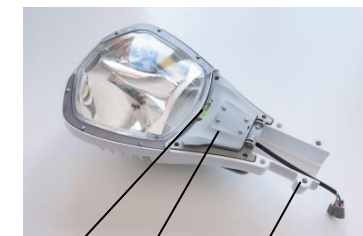
поз.2 поз.1 поз.3